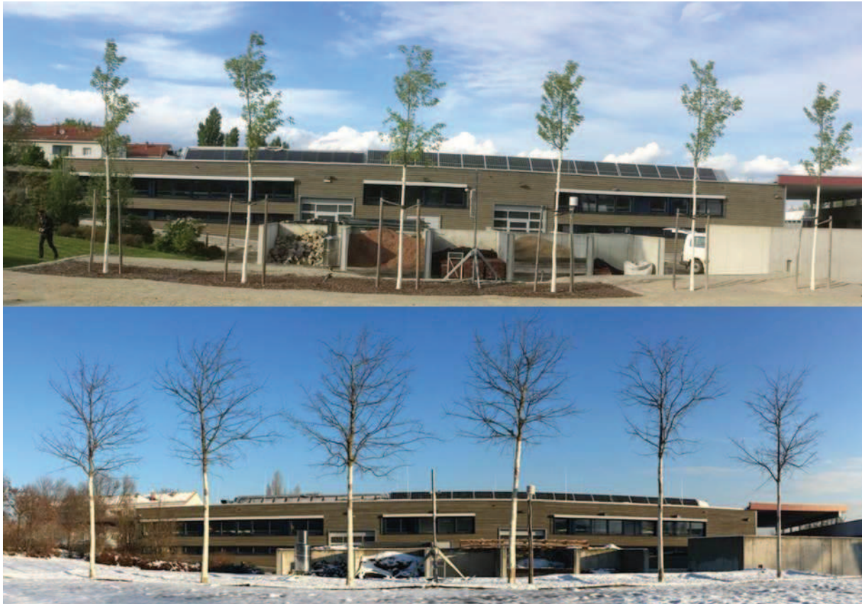
Abbildung 2: Bäume der Baum-Lysimeteranlage in der Außenstelle Jägerhausgasse (Baumkronen vom 12. Juni 2015 und 01. Dezember 2017)

Die Ergebnisse der unterschiedlichen Versuche (Lysimeter und Freilandstandorte) zeigen durchwegs sehr gute Erfolge, sowohl hinsichtlich der prognostizierten Substrateigenschaften als auch im Baumwachstum (Abbildung 2). Die Lysimetermessungen ließen aber auch deutlich erkennen, dass eine längere Lagerungsdauer der Substrate vor dem Einbau von Vorteil ist.